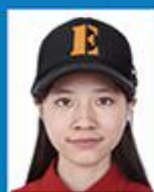
带帽、发饰 遮挡面部、耳朵