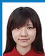
头发遮挡眉毛 眼睛或耳朵