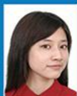
头部侧向一边 或未正视镜头