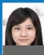
相片损坏 或有污痕