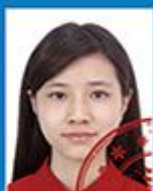
印章或其 他物遮挡人像